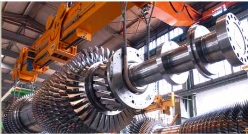
Die Gasturbine SGT5-8000H erreicht in Verbindung mit einer Dampfturbine einen Wirkungsgrad von mehr als 60 Prozent. Die Anlage kann mit 545 Megawatt Leistung eine Stadt mit drei Millionen Einwohnern mit Strom versorgen.

Trotzdem werden für die angestrebte Energiewende vor allem Veränderungen in der Energiepolitik der europäischen Staaten nötig sein. »Langfristig brauchen wir auf technischer Ebene Speichermöglichkeiten für Energie. Die Energiewirtschaft braucht aber dringend ein neues Marktdesign, welches das Bereithalten von Kraftwerkskapazitäten entsprechend vergütet«, schließt Balling. □