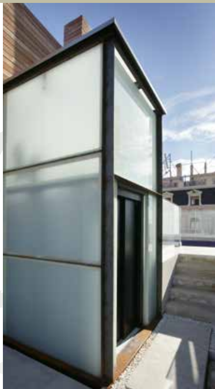
Am Dach installierte Solarpaneele liefern übers Jahr gesehen rund die Hälfte des Strombedarfs der Aufzugsanlagen.