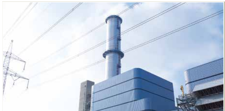
Für die hocheffiziente Gasturbine im bayrischen Irsching wurde Siemens bereits auch mit dem Innovationspreis für Klima und Umwelt des Bundesumweltministeriums und des Bundesverbands der Deutschen Industrie ausgezeichnet.